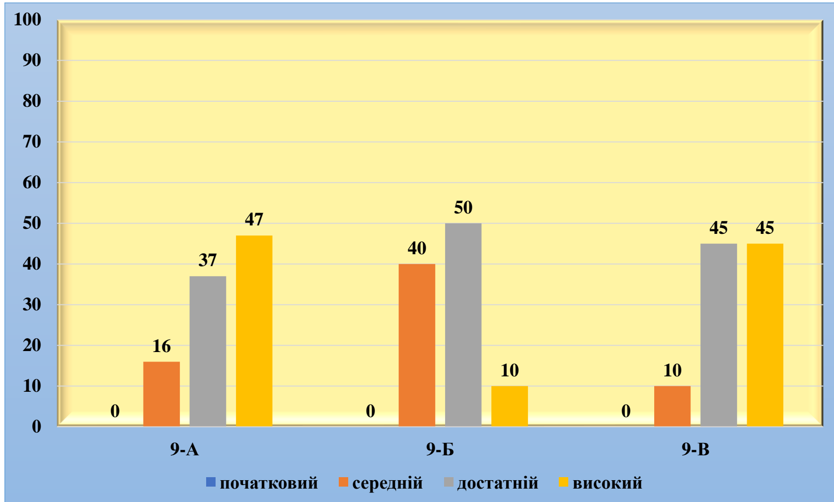
Діаграма моніторингу успішності учнів з основ правознавства 2022/2023 навчальний рік